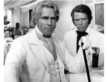
1969 QUEIMADA (Quemada I) de Gillo Pontecorvo avec Marlon Brando