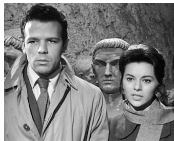
1960 LES ÉVADÉS DE LA NUIT (Era Notte a Roma) de Roberto Rossellini avec Giovanna Ralli