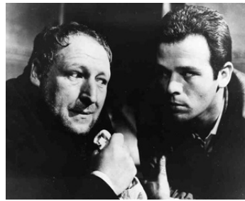
1962 LE DÉSORDRE (Il Disordine) de Franco Brusati avec Georges Wilson