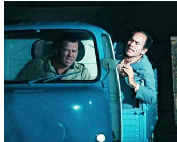
1968 Z (Il est vivant) de Costa-Gavras avec Marcel Bozzuffi