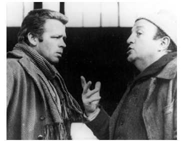
1963 LES CAMARADES (I Compagni) de Mario Monicelli avec Bernard Blier