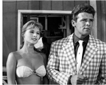
1957 MARISA (Marisa la Civetta) de Mauro Bolognini avec Marisa Allasio