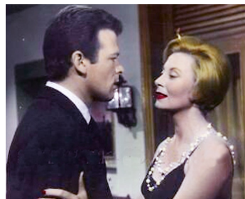
1959 BRÈVES AMOURS (Vacanze d'inverno) de Camillo Mastrocinque avec Michèle Morgan