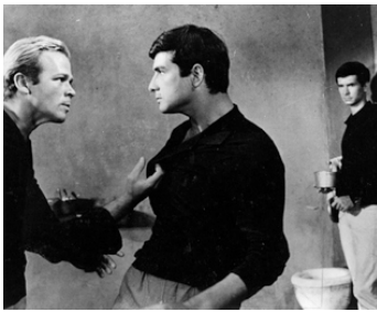
1962 LE GLAIVE ET LA BALANCE d'A. Cayatte avec Jean-Claude Brialy, Anthony Perkins