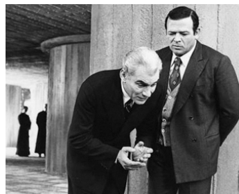
1975 TODO MODO (Todo Modo) d'Elio Petri avec Gian Maria Volonte