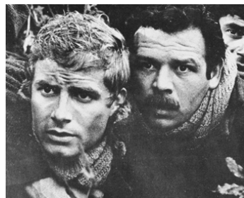
1961 LES PARTISANS ATTAQUENT À L'AUBE (Un Giorno da Leoni) de Nanni Loy avec N. Castelnuovo