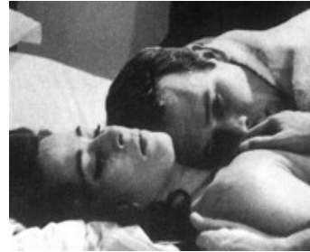
1964 UNA BELLA GRINTA (Una bella Grinta) de Giuliano Montaldo avec Claudine Auger