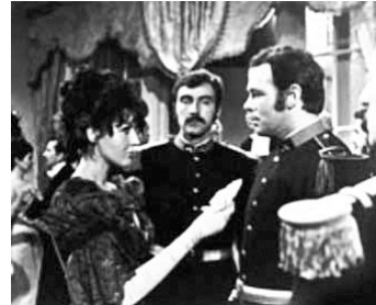
1967 MÉMOIRES DU FUTUR (Los recuerdos del porvenir) d'Arturo Ripstein avec Daniela Rosen