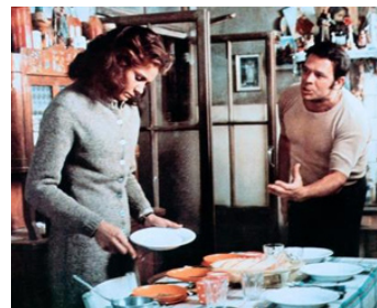
1973 BRÈVES VACANCES (Una breve Vacanza) de Vittorio De Sica avec Florinda Bolkan