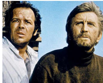
1971 LE PHARE DU BOUT DU MONDE de Kevin Billington avec Kirk Douglas