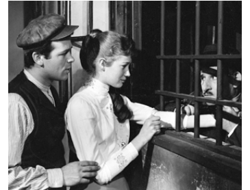
1958 POLYCARPE (Policarpo, ufficiale di scrittura) de Mario Soldati avec Carla Gravina, R. Rascel