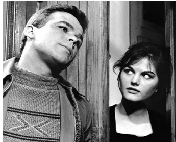
1958 LE PIGEON (I soliti ignoti) de Mario Monicelli avec Claudia Cardinale