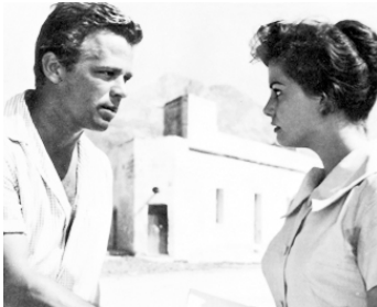
1958 VENT DU SUD (Vento del Sud) d'Enzo Provenza avec Claudia Cardinale