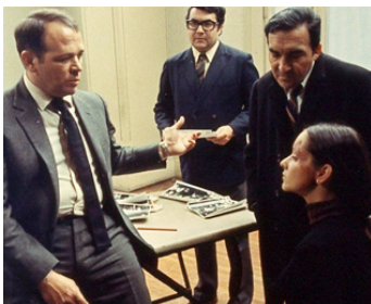
1972 ÉTAT DE SIÈGE de Costa-Gavras avec Marta Contreras