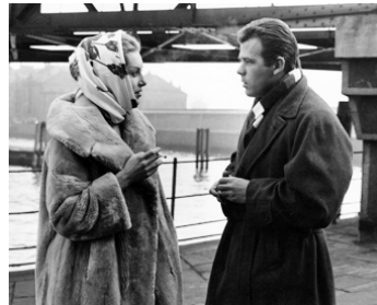
1959 LES COLPORTEURS (I Magliari) de Francesco Rosi avec Belinda Lee