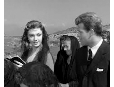
1957 L'IMPOSSIBLE ISABELLE (La Nonna Sabella) de Dino Risi avec Sylva Koscina