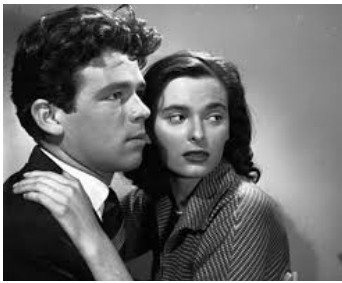
1951 LES FIANCÉES DE ROME (Le Ragazze di piazza di Spagna) de Luciano Emmer avec Lucia Bosé