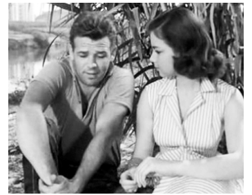
1956 PAUVRES MAIS BEAUX (Poveri ma belli) de Dino Risi avec Loretta De Luca