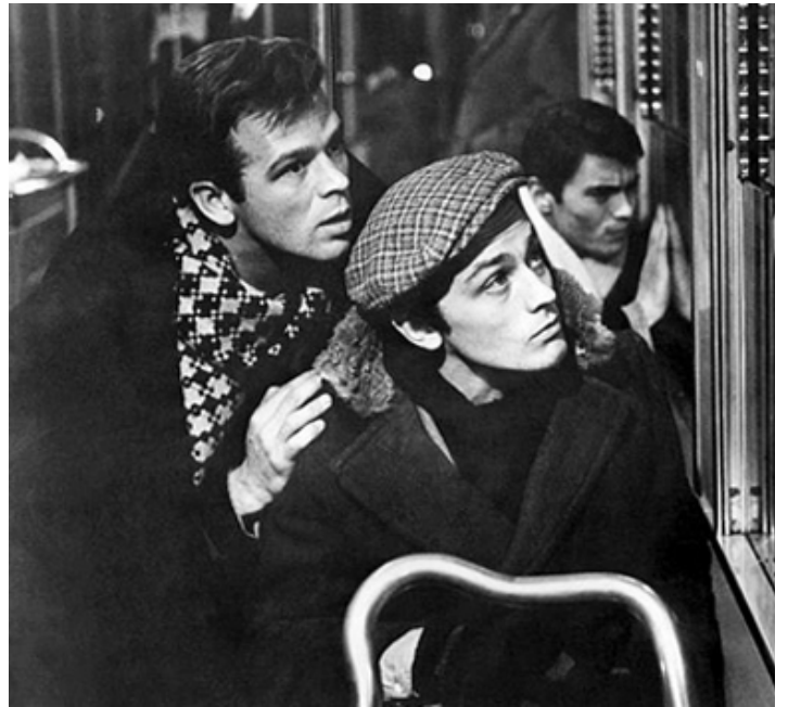
1960 ROCCO ET SES FRÈRES (Rocco e i suoi fratelli) de Luchino Visconti avec Alain Delon