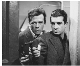
1962 LA BANDE CASAROLI (La Banda Casaroli) de Florestano Vancini avec Jean-Claude Brialy