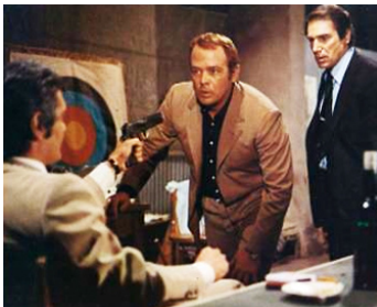
1970 LE CASSE d'Henri Verneuil avec Omar Sharif, Robert Hossein