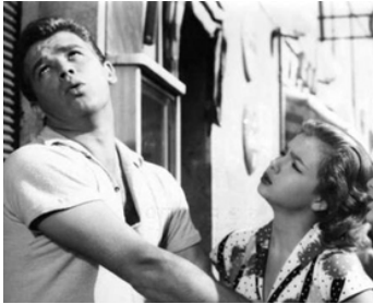
1957 BELLES MAIS PAUVRES (Belle ma povere) de Dino Risi avec Marisa Allasio