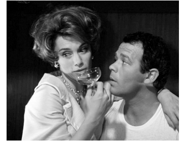
1965 BEL-AMI 2000 (100 Ragazze per un playboy) de Michael Pfleghar avec Linda Christian