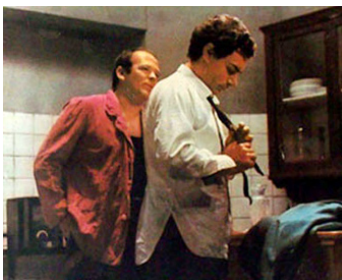
1975 LE SOUPÇON (Il Sospetto) de Francesco Maselli avec Gian Maria Volonte