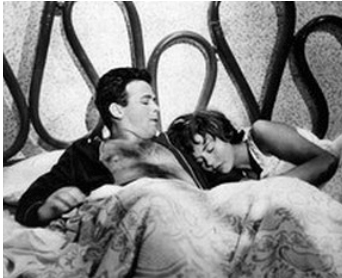
1958 FEMMES DANGEREUSES (Mogli pericolose) de Luigi Comencini avec Georgina Moll