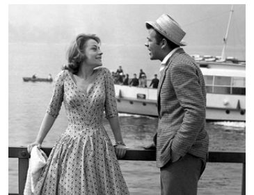
1961 SMOG (Smog) de Franco Rossi avec Annie Girardot