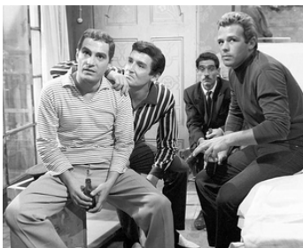
1959 HOLD-UP À LA MILANAISE (Audace colpo dei soliti ignoti) de Nanni Loy avec Nino Manfredi, V. Gassman