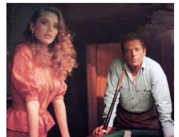
1979 LA CIGALE (La Cicala) d'Alberto Lattuada avec Barbara De Rossi