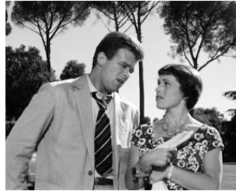
1957 MARIS EN LIBERTÉ (Mariti in città) de Mauro Bolognini avec Franca Valeri