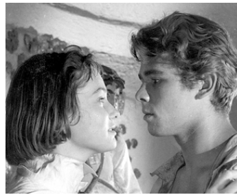
1954 LA FILLE DU CORSAIRE NOIR (Jolanda la figlia del corsaro nero) de Mario Soldati avec May Britt