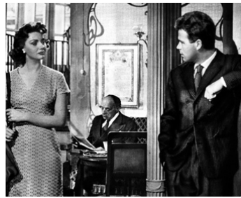
1953 UN DIMANCHE ROMAIN (La domenica della buona gente) d'A. G. Majano avec Sophia Loren