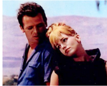
1964 TROIS NUITS D'AMOUR (Tre Notti d'Amore) de Renato Castellani avec Catherine Spaak