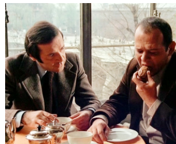
1976 ARMAGUEDON d'Alain Jessua avec Jean Yanne