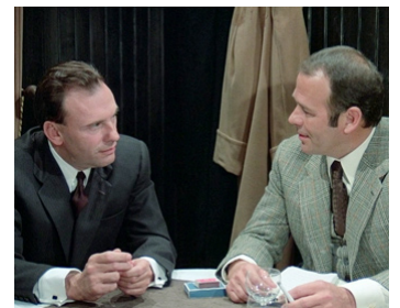
1974 FLIC STORY de Jacques Deray avec Jean-Louis Trintignant