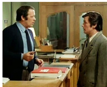
1972 LES GRANGES BRÛLÉES de Jean Chapot avec Alain Delon